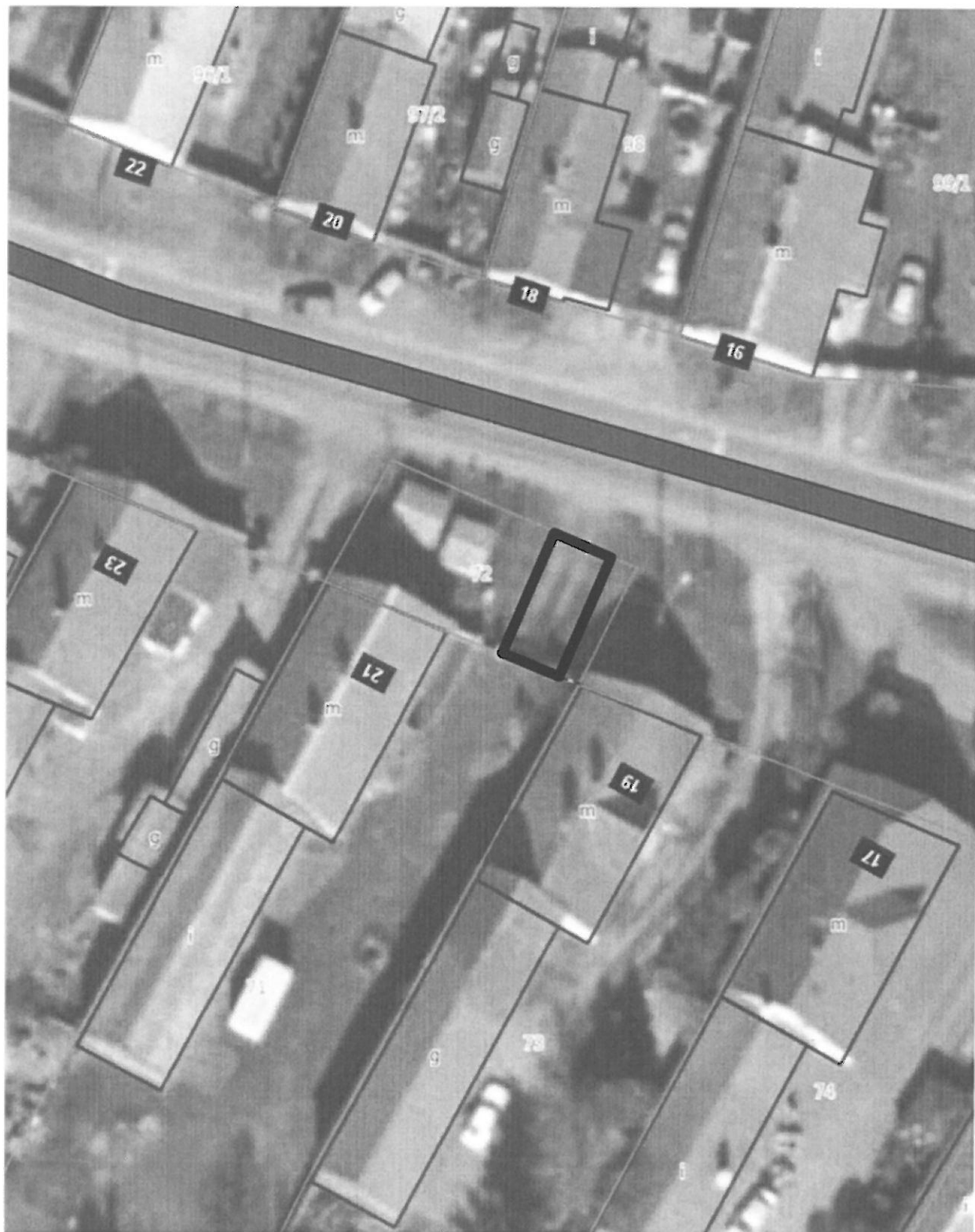
————— Oznaczenie terenu, dla którego ustanawia się służebność