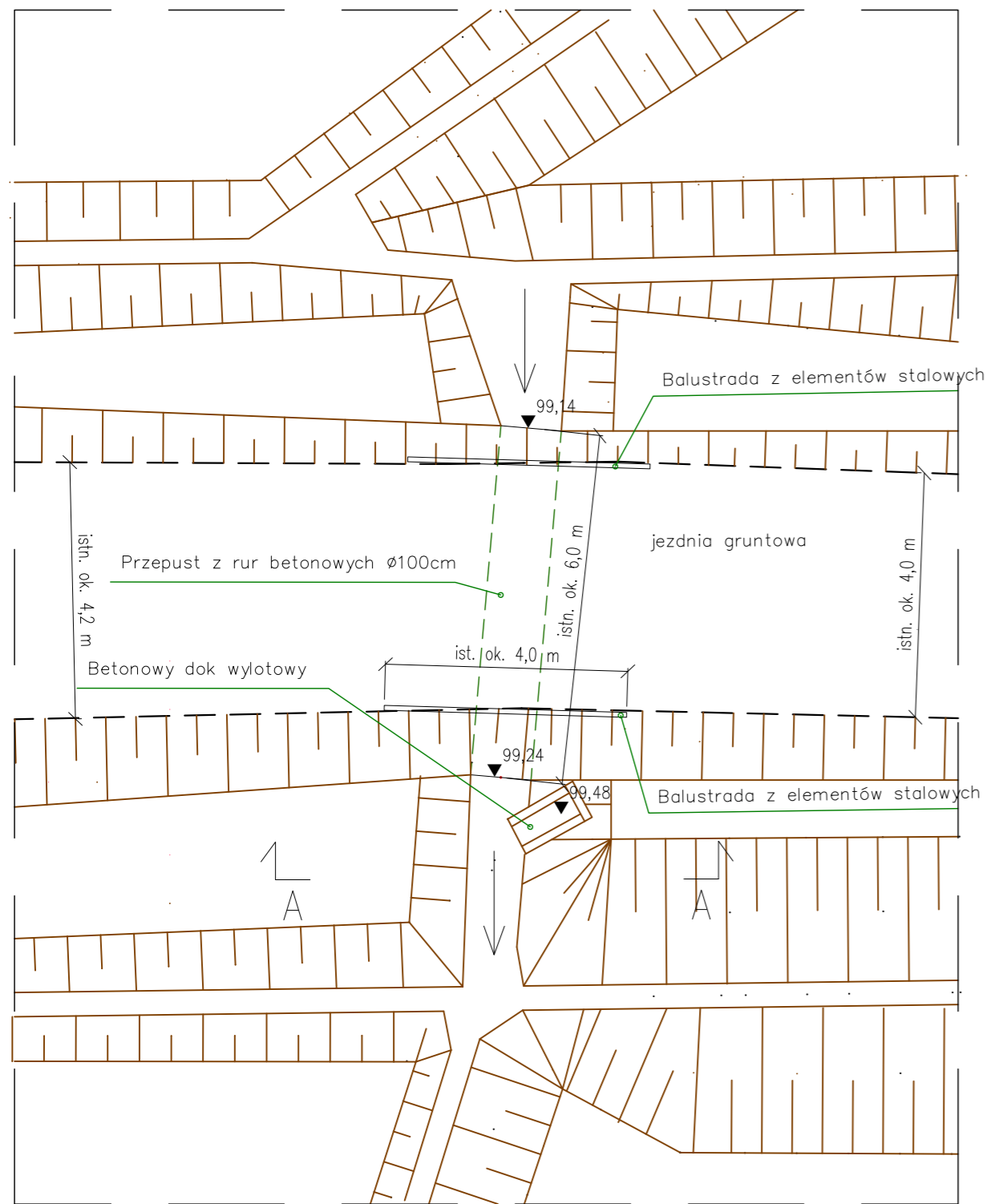
widok z góry skala 1:100