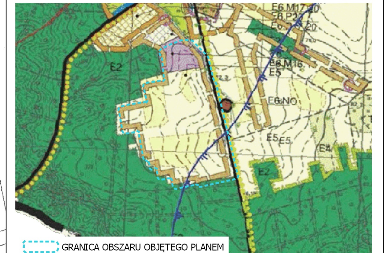
GRANICA OBSZARU OBJĘTEGO PLANEM

Wyrys ze Studium uwarunkowań i kierunków zagospodarowania przestrzennego Gminy Zabór, uchwalonego uchwałą nr VI.34.2019 Rady Gminy Zabór z dnia 28 marca 2019 r.